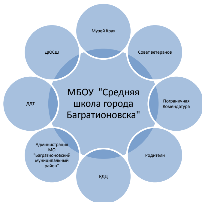
Схема взаимодействия школы с субъектами воспитания по организации работы по патриотическому воспитанию обучающихся.